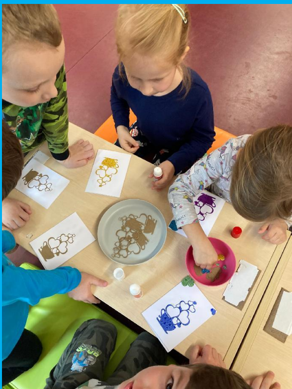
Kolektiv MŠ Jungmannova

Po tvoření si děti pohrály v prostorech centra KuřiMaTa. Postavily si hrad z velkých molitanových kostek a vyzkoušely nové hračky, které ve školce nemají. Velice si ceníme spolupráce s KuřiMaty.