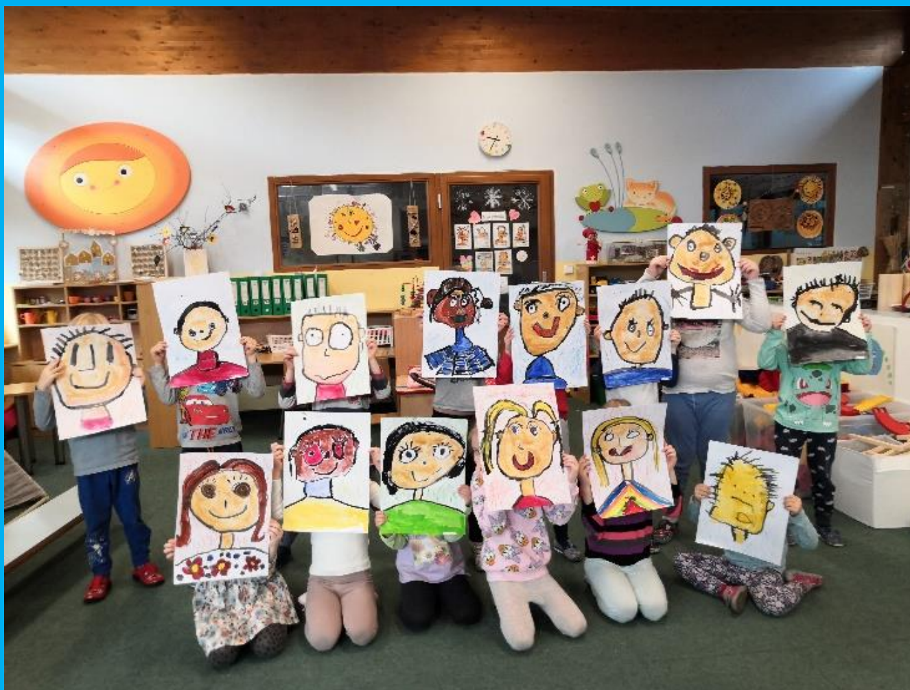
Kolektiv MŠ Brněnská, Kuřim